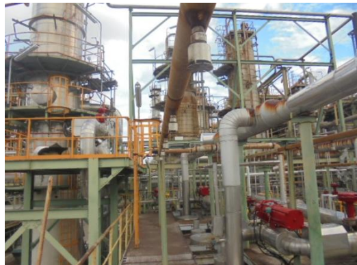
รูปที่ 3-50 Fixed Foam Spray System

ภาพถ่ายประกอบผลการปฏิบัติตามมาตรการป้องกัน และแก้ไขผลกระทบสิ่งแวดล้อม โครงการโรงงานผลิตคาโปรแลคตัม บริษัท อุเบะ เคมิคอลส์ (เอเชีย) จำกัด (มหาชน) (ต่อ)