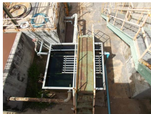
รูปที่ 3-11 Oil Separation System

ภาพถ่ายประกอบผลการปฏิบัติตามมาตรการป้องกัน และแก้ไขผลกระทบสิ่งแวดล้อม โครงการโรงงานผลิตคาโปรแลกต์ บริษัท อุเบะ เคมิคอลส์ (เอเชีย) จำกัด (มหาชน) (ต่อ)