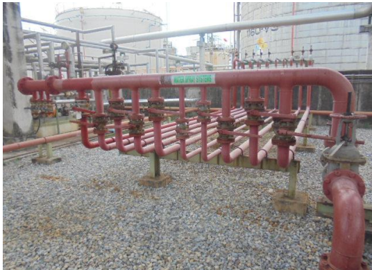
รูปที่ 3-45 Fixed Water Suppression System