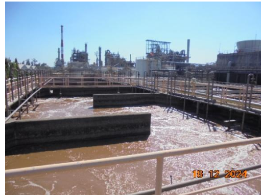
รูปที่ 3-13 Activated Sludge System