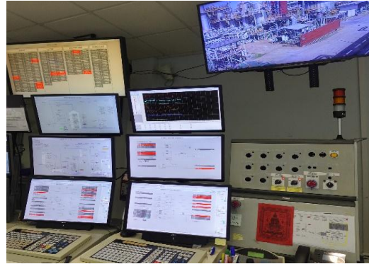
รูปที่ 3-7 Interlock System