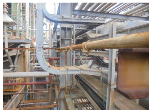
รูปที่ 3-44 Water Curtain System

ภาพถ่ายประกอบผลการปฏิบัติตามมาตรการป้องกัน และแก้ไขผลกระทบสิ่งแวดล้อม โครงการโรงงานผลิตคาโปรแลคตัม บริษัท อุเบะ เคมีคอลส์ (เอเชีย) จำกัด (มหาชน) (ต่อ)