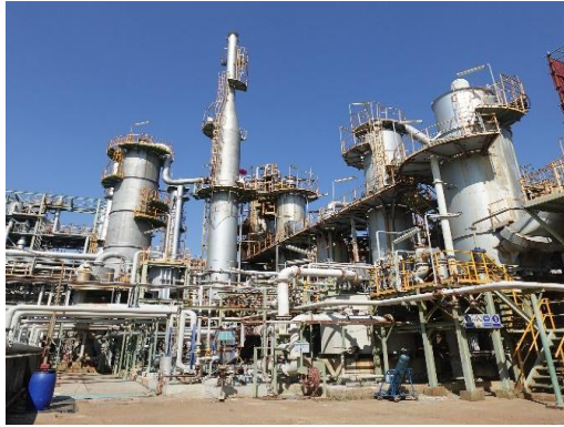
รูปที่ 3-6 Double-Contact/Double Absorption เพื่อบำบัด SO 2 และ Acid Mist