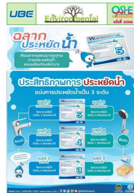
รูปที่ 3-25 บอร์ดประชาสัมพันธ์ รณรงค์ใช้น้ำอย่างประหยัด