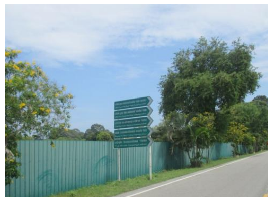
รูปที่ 3-33 ป้ายและสัญลักษณ์ให้ผู้ขับขี่ยานพาหนะ รับทราบล่วงหน้าก่อนถึงพื้นที่โครงการ

ภาพถ่ายประกอบผลการปฏิบัติตามมาตรการป้องกัน และแก้ไขผลกระทบสิ่งแวดล้อม โครงการโรงงานผลิตคาโปรแลคตัม บริษัท อุเบะ เคมีคอลส์ (เอเชีย) จำกัด (มหาชน) (ต่อ)