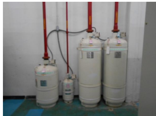
รูปที่ 3-52 Clean Agent Fire Extinguishing System (FM-200)