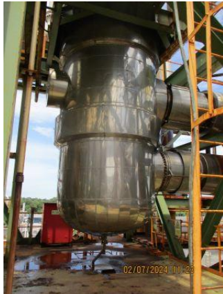
รูปที่ 3-1 Waste Gas Treatment Off Gas เพื่อบำบัด \text{NO}_x