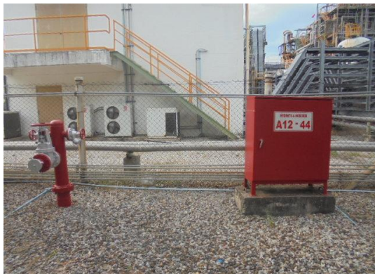
รูปที่ 3-41 Water Hydrant and Hose Box