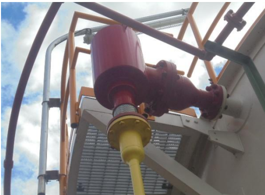
รูปที่ 3-49 Fixed Foam Discharge Outlet