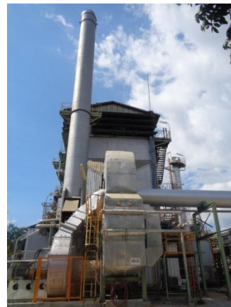
รูปที่ 3-9 อุปกรณ์บำบัดฝุ่น (Electrostatic Precipitator) จาก Boiler Type