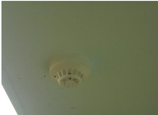
รูปที่ 3-39 Heat Detector