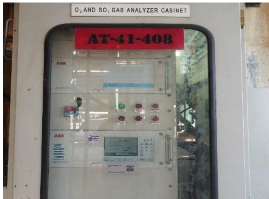
รูปที่ 3-3 ระบบควบคุมกำมะถัน (4140-C6)