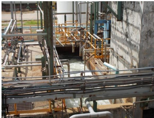
รูปที่ 3-20 Chemical Sewer