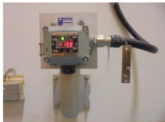
รูปที่ 3-38 Gas Detector

ภาพถ่ายประกอบผลการปฏิบัติตามมาตรการป้องกัน และแก้ไขผลกระทบสิ่งแวดล้อม โครงการโรงงานผลิตคาโปรแลคตัม บริษัท อุเบะ เคมิคอลส์ (เอเชีย) จำกัด (มหาชน) (ต่อ)