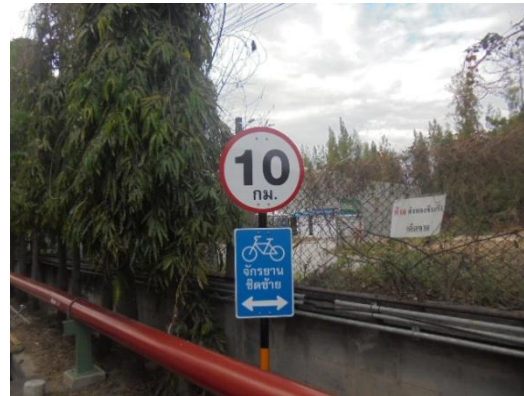
รูปที่ 3-34 ป้ายจำกัดความเร็วรถ