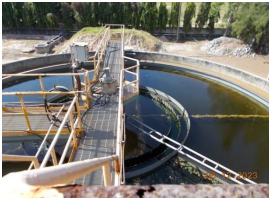
รูปที่ 3-14 Flocculation & Sedimentation