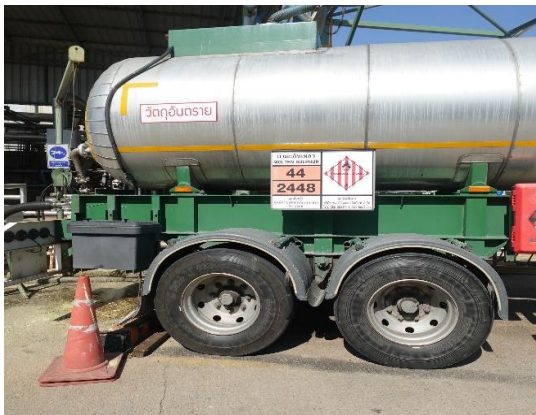
รูปที่ 3-35 ป้ายข้อมูลสารเคมีที่รถขนส่ง