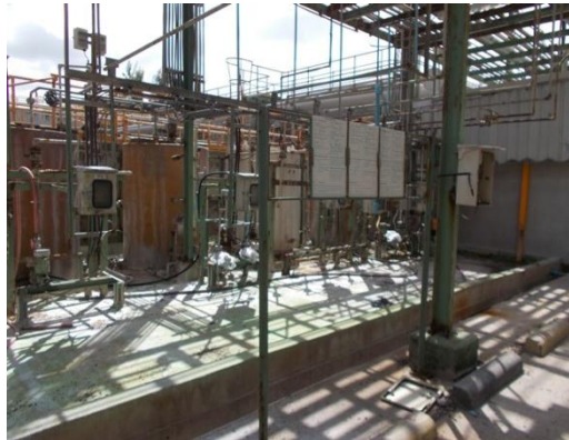
รูปที่ 3-12 pH Adjustment System