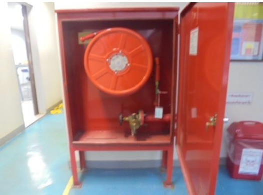
รูปที่ 3-47 Stand Pipe and Hose System