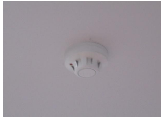
รูปที่ 3-40 Smoke Detector