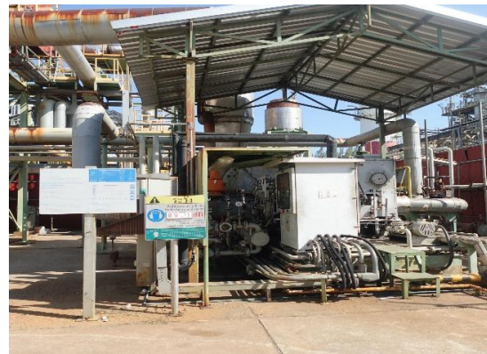
รูปที่ 3-31 ป้ายเตือนให้พนักงานสวมใส่อุปกรณ์ ป้องกันเสียงดัง