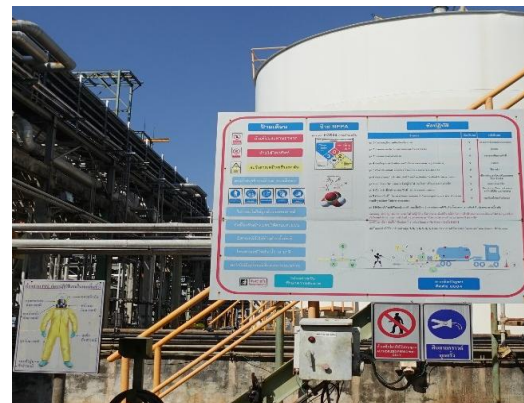
รูปที่ 3-54 ข้อมูลความปลอดภัยของสารเคมี (SDS)