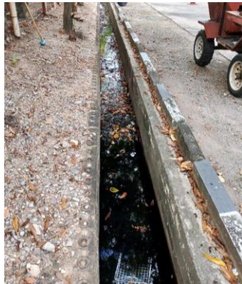
รูปที่ 3-24 การขุดลอกรางระบายน้ำ