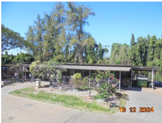
รูปที่ 3-30 อาคารเก็บกากของเสียรอกำจัด (Waste Holding Building)