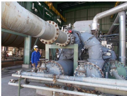
รูปที่ 3-32 ฉนวนกันเสียงในบริเวณที่มีเสียงดัง