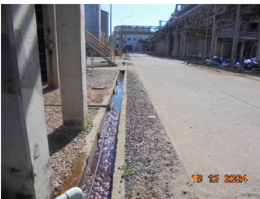
รูปที่ 3-10 รางระบายน้ำแบบเปิด