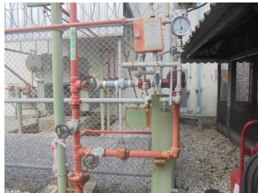
รูปที่ 3-42 Deluge System