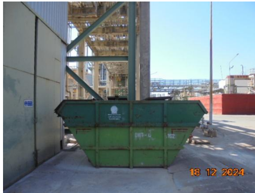
รูปที่ 3-29 ถังเก็บรวบรวมขยะทั่วไปรอส่งกำจัด