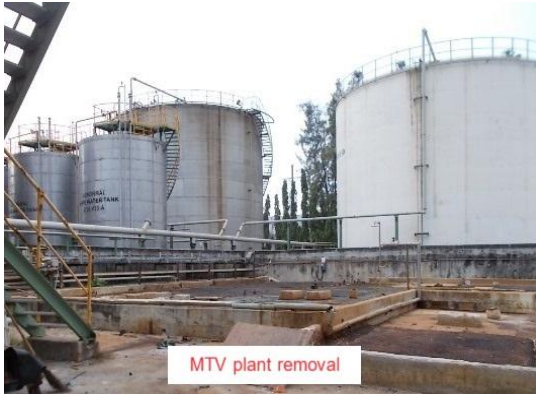
รูปที่ 3-18 ระบบบำบัดน้ำเสียทางเคมีและชีวภาพ