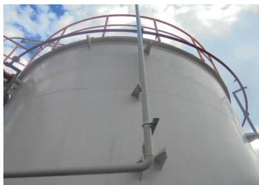
รูปที่ 3-43 Fixed Water Spray System