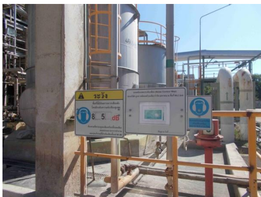
รูปที่ 3-37 ป้ายเตือนให้พนักงานสวมใส่อุปกรณ์ คุ้มครองความปลอดภัยส่วนบุคคล