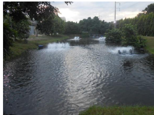
รูปที่ 3-23 Holding Pond

ภาพถ่ายประกอบผลการปฏิบัติตามมาตรการป้องกัน และแก้ไขผลกระทบสิ่งแวดล้อม โครงการโรงงานผลิตคาโปรแลคตัม บริษัท อุเบะ เคมิคอลส์ (เอเชีย) จำกัด (มหาชน) (ต่อ)