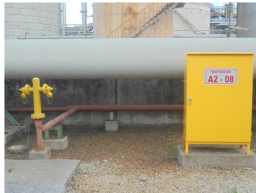
รูปที่ 3-48 Foam Hydrant