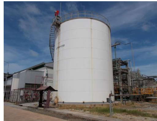
รูปที่ 3-21 Equalization Cooler