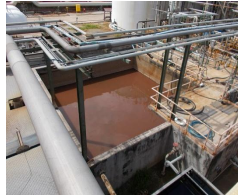
รูปที่ 3-19 Oily Sewer