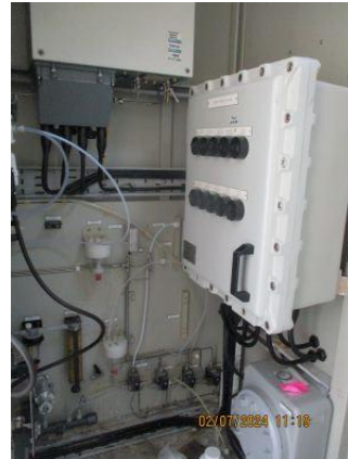
รูปที่ 3-2 เครื่องตรวจวัดความเข้มข้นของมลพิษ ทางอากาศอย่างต่อเนื่อง (CEMS)