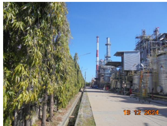
รูปที่ 3-58 พื้นที่สีเขียว