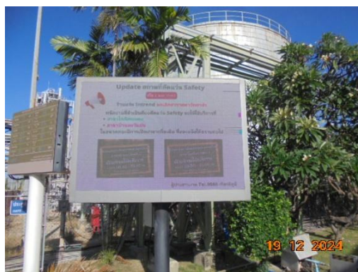
รูปที่ 3-55 บอร์ดประชาสัมพันธ์ด้านความปลอดภัย อาชีวอนามัย และสิ่งแวดล้อม

ภาพถ่ายประกอบผลการปฏิบัติตามมาตรการป้องกัน และแก้ไขผลกระทบสิ่งแวดล้อม โครงการโรงงานผลิตคาโปรแลกต์ม บริษัท อุเบะ เคมิคอลส์ (เอเชีย) จำกัด (มหาชน) (ต่อ)