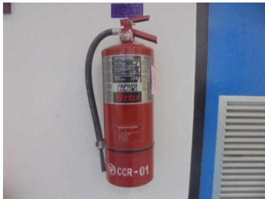
รูปที่ 3-51 Portable Fire Extinguisher