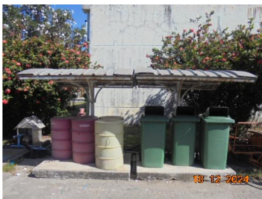
รูปที่ 3-28 จัดขยะแบบแยกประเภท