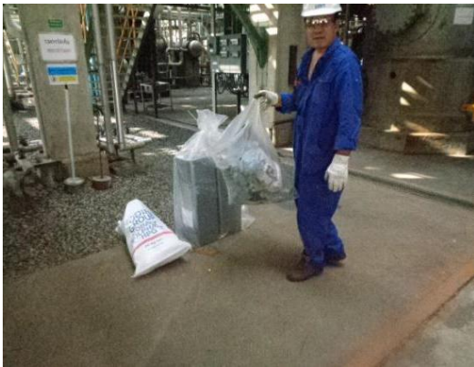
รูปที่ 3-8 การทำความสะอาดหน่วยผลิต