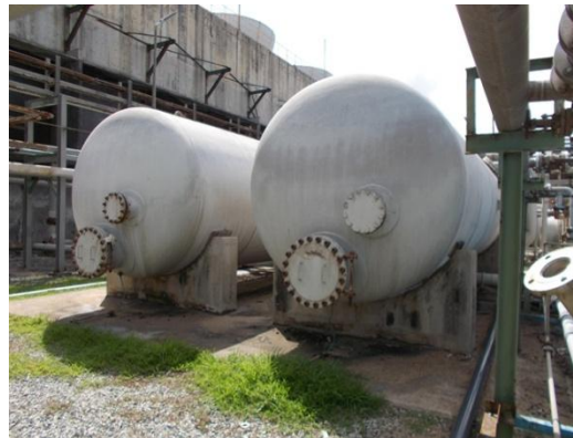
รูปที่ 3-15 Filtering System