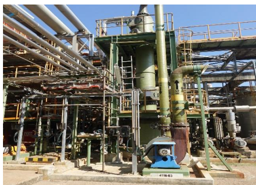
รูปที่ 3-5 ระบบกำจัดกลิ่นกำมะถัน (Sulfur Scrubber 4110-S1)

ภาพถ่ายประกอบผลการปฏิบัติตามมาตรการป้องกัน และแก้ไขผลกระทบสิ่งแวดล้อม โครงการโรงงานผลิตคาปรีแลคตัม บริษัท อุเบะ เคมิคอลส์ (เอเชีย) จำกัด (มหาชน)