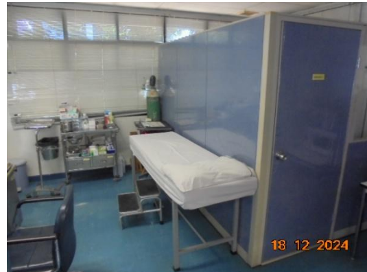
รูปที่ 3-57 ห้องพยาบาล