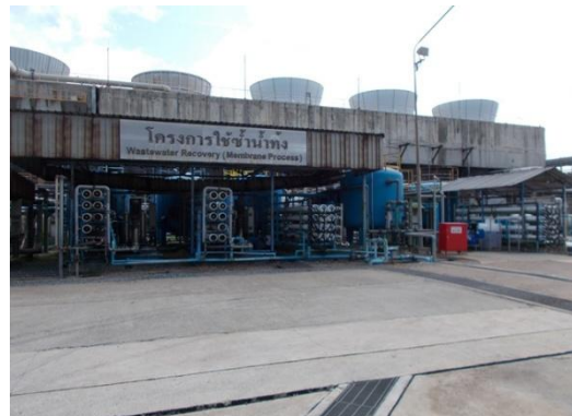
รูปที่ 3-17 Reverse Osmosis

ภาพถ่ายประกอบผลการปฏิบัติตามมาตรการป้องกัน และแก้ไขผลกระทบสิ่งแวดล้อม โครงการโรงงานผลิตคาโปรแลกตั้ม บริษัท อุเบะ เคมิคอลส์ (เอเชีย) จำกัด (มหาชน) (ต่อ)