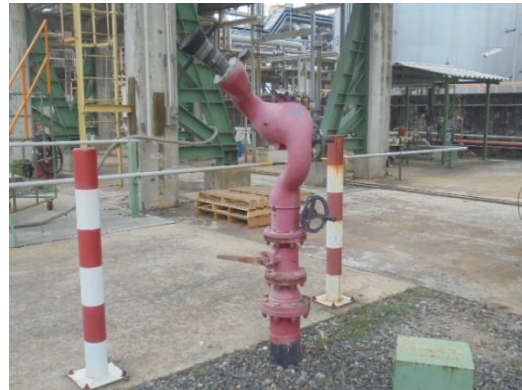
รูปที่ 3-46 Fixed Water Monitor