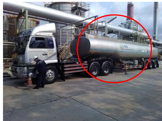
รูปที่ 3-27 รถขนส่ง/รถขนส่งกากของเสีย ที่มีการติดหมายเลขโทรศัพท์