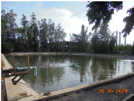
รูปที่ 3-22 Final Check Basin ขนาด 3,300 ลูกบาศก์เมตร