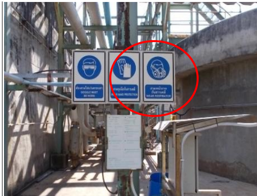
รูปที่ 3-56 ป้ายความปลอดภัยให้สวมหน้ากาก กันสารเคมี