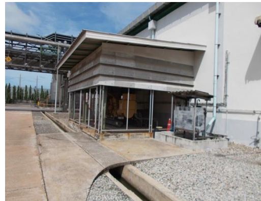
รูปที่ 3-4 ระบบไฟฟ้าสำรองของโรงงาน