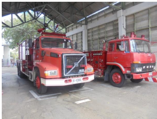
รูปที่ 3-53 Fire Truck