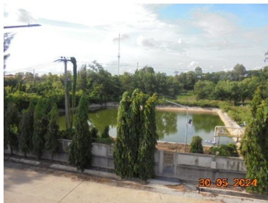
รูปที่ 3-59 บ่อรองรับน้ำฝนปนเปื้อน

ภาพถ่ายประกอบผลการปฏิบัติตามมาตรการป้องกัน และแก้ไขผลกระทบสิ่งแวดล้อม โครงการโรงงานผลิตคาโปรแลกตั้ม บริษัท อุเบะ เคมิคอลส์ (เอเชีย) จำกัด (มหาชน) (ต่อ)