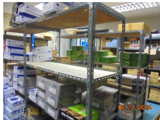
รูปที่ 3-36 อุปกรณ์คุ้มครองความปลอดภัยส่วนบุคคล